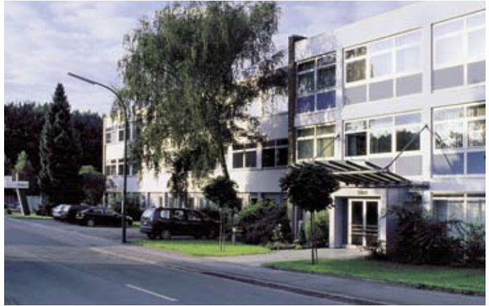
Diagramm Halbach verfügt als eine der profiliertesten Spezialdruckereien in Europa über exzellente Kapazitäten für das Design der dotforms Formulare, das Drucken (sowohl im Offset- wie auch im Digitaldruck-Verfahren) und die buchbinderische Weiterverarbeitung zum Endprodukt.

Wir entwickeln die komplette Applikation von den Spezifikationen des Kunden bis zur finalen Implementierung in der IT-Umgebung.