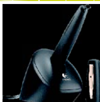
Diagramm Halbach GmbH & Co. KG

Am Winkelstück 14 58239 Schwerte/Germany