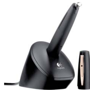
Diagramm Halbach GmbH & Co. KG